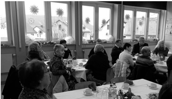
Adventsfrühstück in der Valentin-Pfeifer-Volksschule